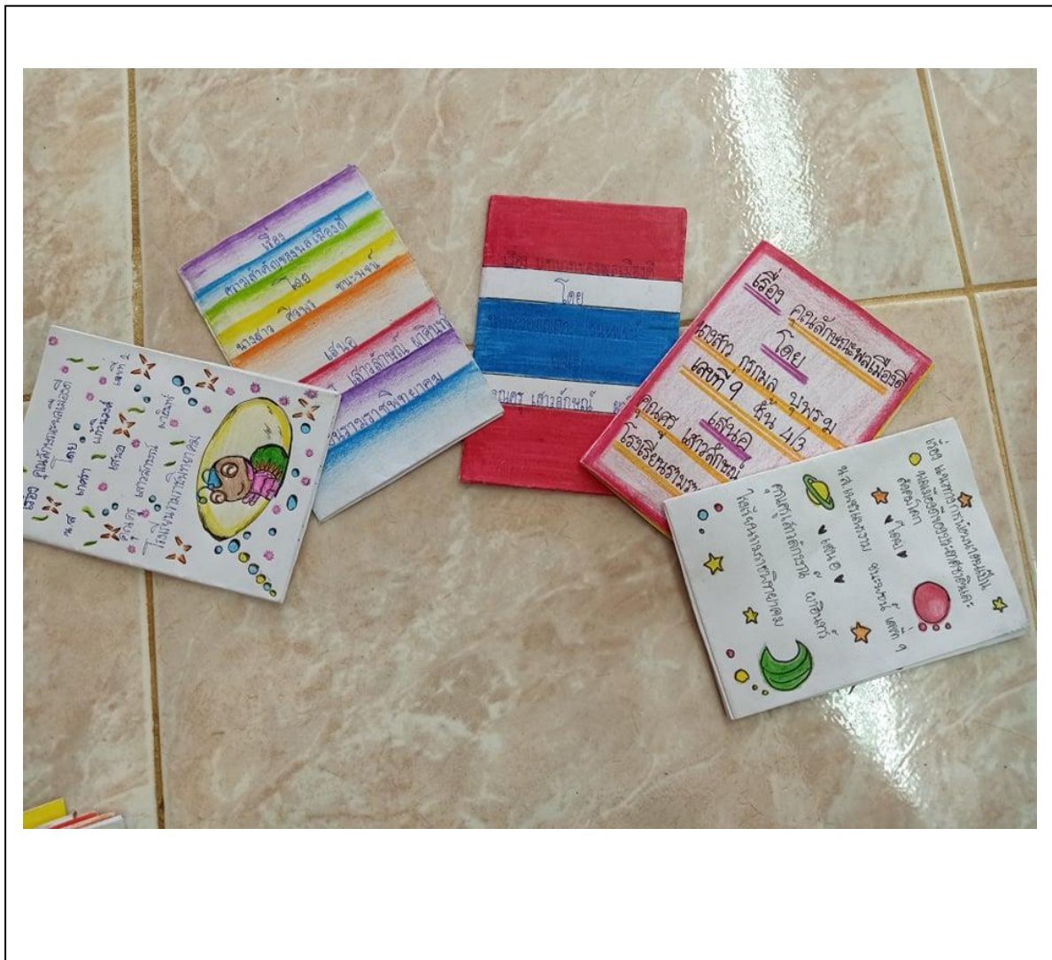
ภาพประกอบ