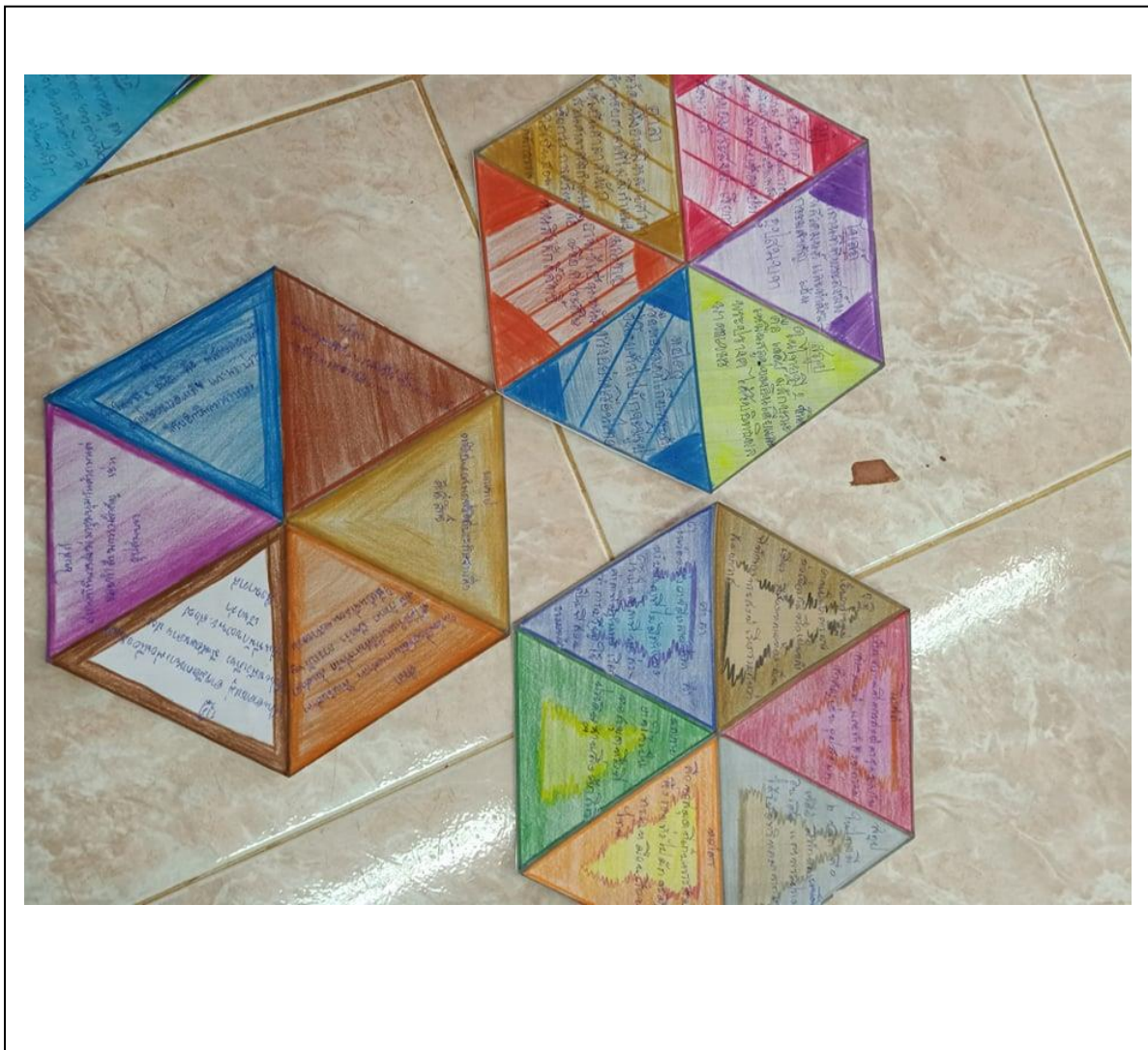
ภาพประกอบ