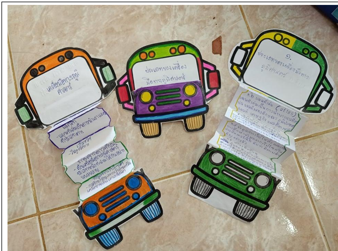
ภาพประกอบ