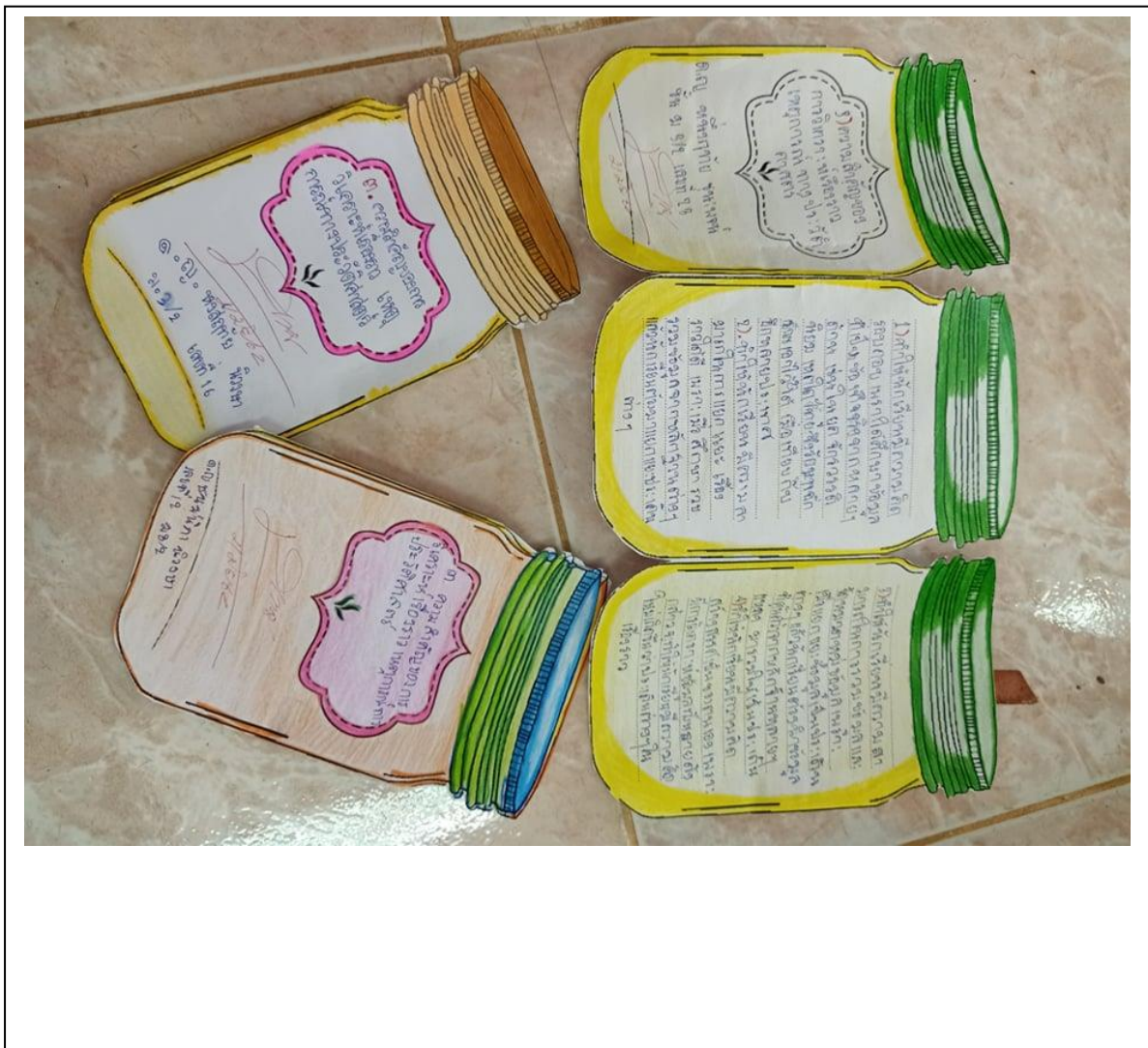
ภาพประกอบ