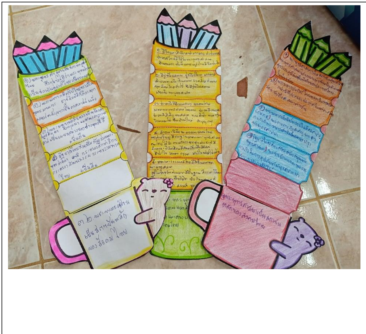
ภาพประกอบ